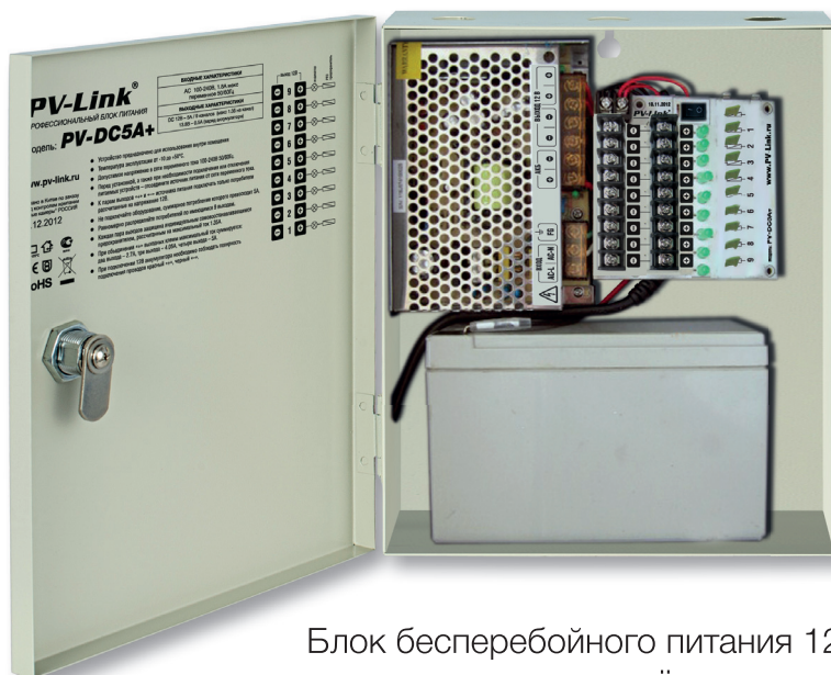
Блок бесперебойного питания 12В 5А с девятью защищёнными выходами