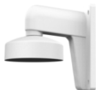
DS-1272ZJ-110 Настенный кронштейн