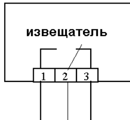
Рис.2 Под воздействием магнитного поля контакт 2 размыкается с контактом 3 и замыкается с контактом 1. Маркировка выводов: 1- красный, 2- черный, 3- белый