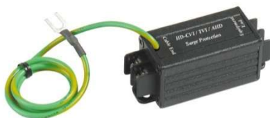
Рис. 1 Внешний вид SP009T