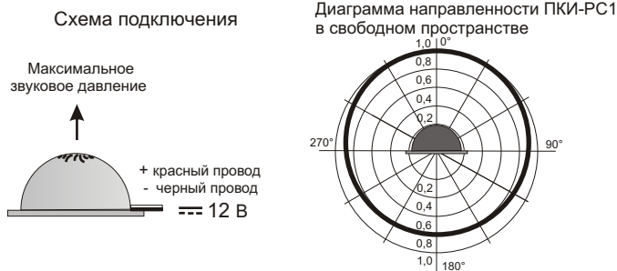
Рис.2 Схема подключения и диаграмма направленности Оповещателя ПКИ-РС1.

5.4. На рис.2 показана схема подключения и диаграмма направленности звука оповещателя ПКИ-РС1.