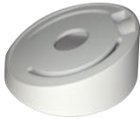
DS-1259ZJ Потолочное крепление