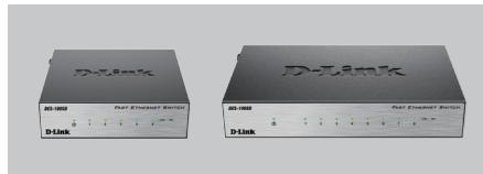
DES-1005D / DES-1008D

These are the items included with your DES-1005D / DES-1008D purchase: