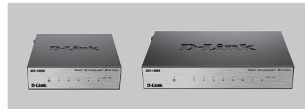
DES-1005D / DES-1008D

В комплект поставки DES-1005D / DES-1008D входит следующее: