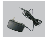
Адаптер питания постоянного тока

⚠ Замечание: Использование источника питания с другим напряжением питания может привести к выходу из строя устройства и потере гарантии.