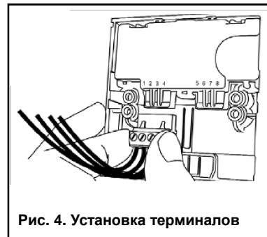
Рис. 4. Установка терминалов