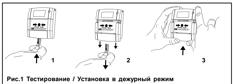
Рис.1 Тестирование / Установка в дежурный режим

Возврат в дежурный режим извещателя с приводным элементом в виде пластиковой пластины (рис.1) осуществляется при помощи специального ключа, поставляемого в комплекте с извещателем. Для этого ключ вставляется в двойное отверстие в нижней части кассеты (полурамки), удерживающей приводной элемент, кассета вместе с ключом и приводным элементом сдвигается вниз относительно корпуса извещателя приблизительно на 1 см, ключ удаляется из кассеты и кассета возвращается в первоначальное положение путем сдвига её вверх до упора. Пластиковая гибкая пластина не требует замены в течении всего срока эксплуатации.