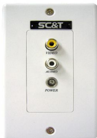
Рис.1 Внешний вид передней панели