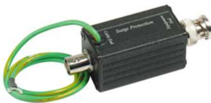
Рис.1 Внешний вид SP009