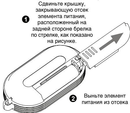
Рисунок 2. Извлечение использованного элемента питания.

Замените элемент питания согласно нижеприведенному рисунку.