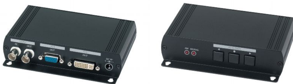
Рис.1 Внешний вид AD001HD