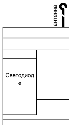
Рис. 1. Внешний вид приемника

75 x 120 x 32 мм (без антенны) 75 x 265 x 32 мм (с антенной)